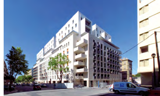
© LAURENT CARTE / STUDIO MAGELLAN